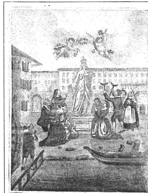
100° CENTENARIO DELLA R. VERGINE DEI MULINI 1814-2014